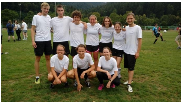
Wir sind auch mal sportlich unterwegs!

Wir freuen uns sehr auf Euch, wünschen einen guten Start ins Studium und begleiten euch gerne dabei!