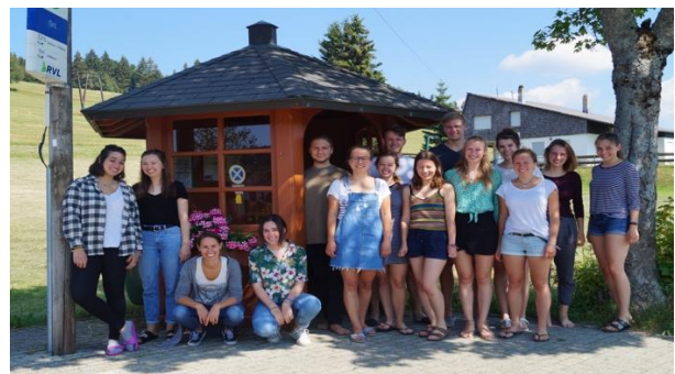
Unsere alljährliche Hütte!