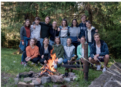
Auf unserer alljährlichen Hütte!

Wir freuen uns auf euch, wünschen euch einen guten Start ins Studium und begleiten euch gerne dabei!